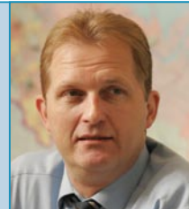
Йорг Шрайбер Генеральный директор Mazda Motor Rus

В полном размере модель, созданная на основе присланного ею описания, демонстрировалась на стенде компании во время проходившего в Лос-Анджелесе автосалона. ML